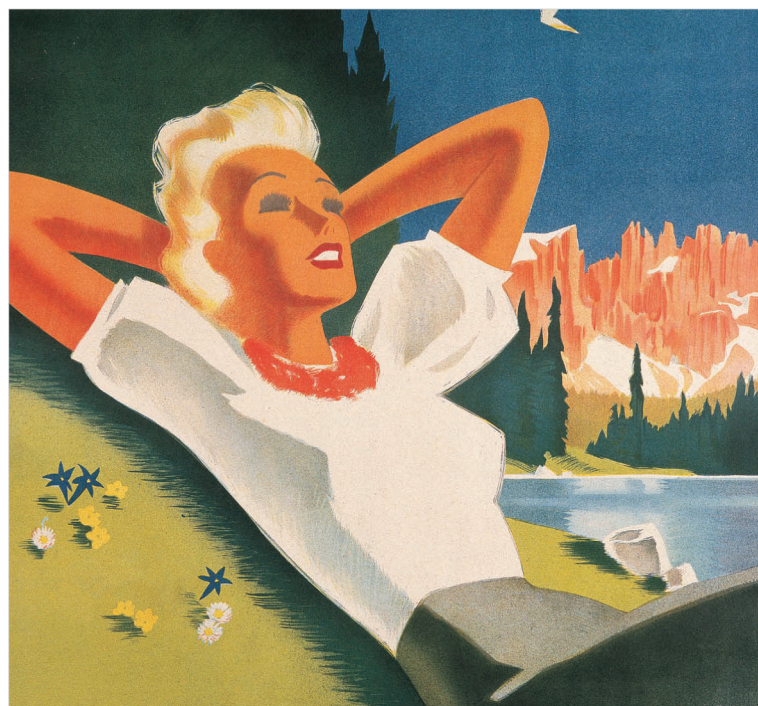
PARTICOLARE DEL MANIFESTO «ESTATE NELLE DOLOMITI» DI FRANZ J. LENHART - 1940