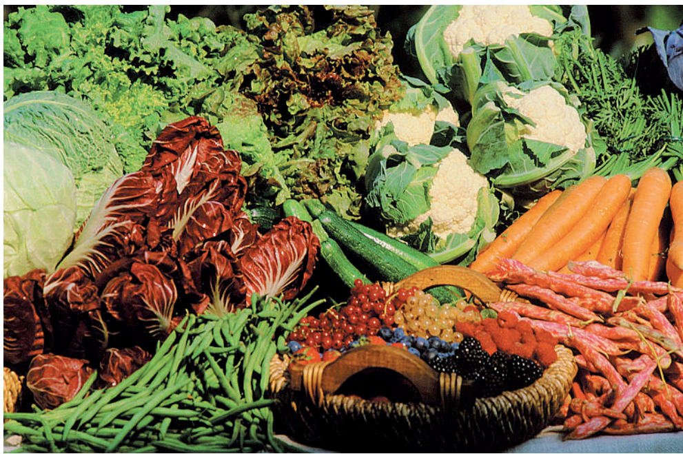
Biologico Le verdure rientrano negli acquisti dei Gas. Le regole: biologico e chilometro zero